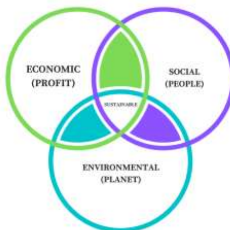
Figura 3. Cei 3 piloni ai sustenabilității